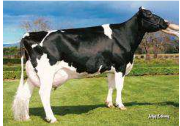
Abuela: Morningview Fnlly Mikki-ET

Padre: S-S-I Domain Lithium-ET TV TL TY TD Madre: Morningview Freddie Mimi-ET EX-90 04-07 2x 365d 37580m 4.1 1533f 3.3 1225p Abuelo: Badger-Bluff Fanny Freddie TV TL TY Abuela: Morningview Shottle Maui-ET TY EX-90 04-08 2x 365d 37300m 3.8 1408f 3.2 1191p Bisabla: Picston Shottle-ET TV TL TY EX-95 Bisabla: Morningview Fnlly Mikki-ET EX-90 GMD 05-00 2x 365d 38590m 3.3 1277f 3.1 1185p