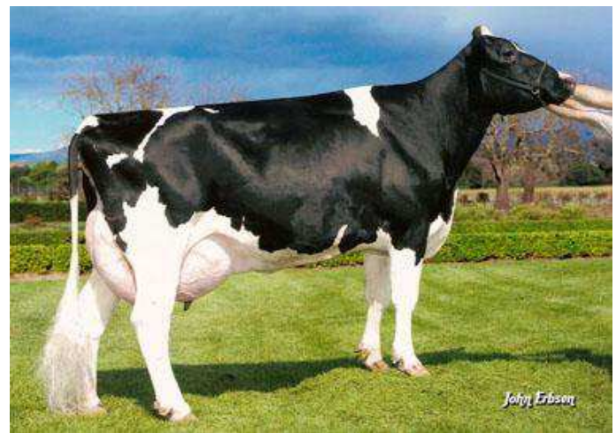
Bisabla: Morningview Fnlly Mikki-ET