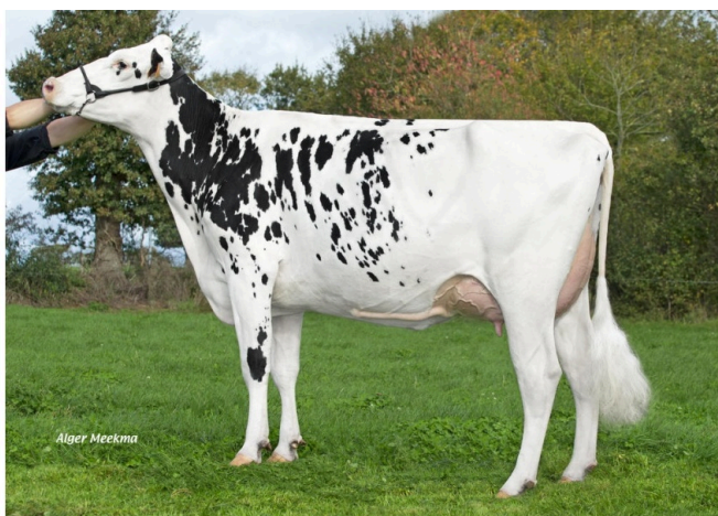
NIACYNTHE Madre de PLESLIN P