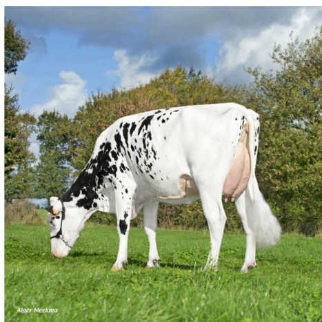
NIACYNTHE Madre de PLESLIN P