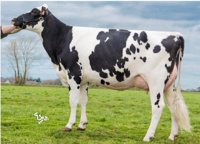
LANTERNE 158 Madre de NEESKENS