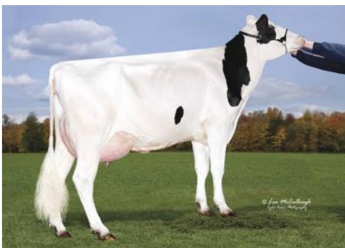
Abuela: Ocd Robust Shimmer-ET