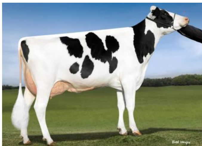
Madre: Ocd Supersire 9882-ET

Padre: Dg Charley Madre: Ocd Supersire 9882-ET VG-86 02-01 3x 365d 31870m 4.1 1310f 3.2 1023p Abuelo: Seagull-Bay Supersire-ET TV TL TY TD Abuela: Ocd Robust Shimmer-ET EX-90 02-03 3x 365d 34350m 3.5 1200f 3.0 1021p Bisablo: Roylane Socra Robust-ET TR TV TL TD Bisabla: Ammon-Peachey Shana-ET VG-87 05-03 2x 335d 41528m 4.3 1792f 2.8 1175p